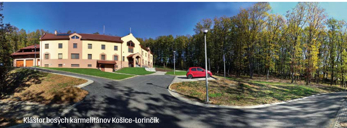
Kláštor bosých karmelitánov Košice-Lorinčík