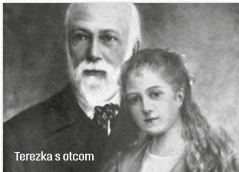
Tereza s otcom

Matka - Zélia Martinová. Srdce rodiny. Vzorná, veriacca manželka a matka. V dievčenskom veku ju najprv priťahovala rehoľa, starostlivosť o chudobných. Keď ju vincentky odmietli, vyučila sa za čipkárku (podľa vnútorného impulzu Panny Márie) a úspešne viedla vlastnú čipkársku dielňu (mala v podnikaní taký úspech, že manžel po niekoľkých rokoch zatvoril svoje hodinárstvo-klenotníctvo a začal vybavovať objednávky pre čipkársku dielňu). Pri náhodnom stretnutí s Ľudovítom Martinom znova vnímala vnútorný impulz,