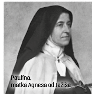
Paulína, matka Agnesa od Ježiša

Leónia - v reholi vizitantiek sestra Františka Terézia (1863). „Čierna ovca“ v rodine Martinovcov. Nevynikala ani krásou ani bystrým rozumom, ani otvorenou a spoločenskou povahou ako jej sestry. V útlom veku takmer zomrela, ale na orodovanie Zéliinej sestry, rehoľníčky v ráde vizitantiek, bola uzdravená. Veľmi prežívala smrť svojej sestričky Helenky vo veku piatich rokov. Tým stratila svoju dôverníčku a cítila veľkú prázdnotu a samotu srdca.