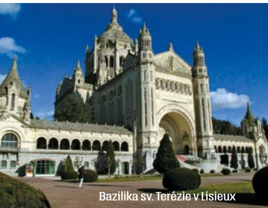
Bazilika sv. Terézie v Lisieux