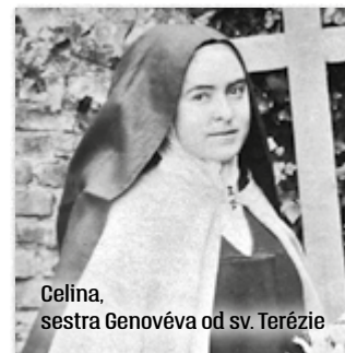
Celina, sestra Genovéva od sv. Terézie