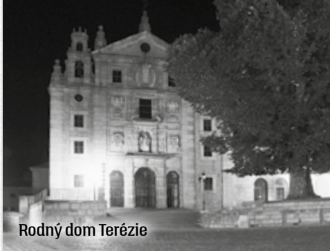
Rodný dom Terézie

V Roku sv. Terézie z Avily, počas osláv 500. výročia jej narodenia, putovali od 23. do 29. augusta 2015 členovia spoločenstiev Svetského rádu bosých karmelitánov z Bratislavy, Detvy a Prahy po stopách svätej Terézie z Avily v Španielsku.