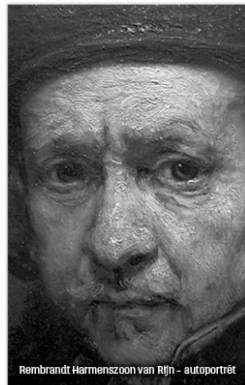
Rembrandt Harmenszoon van Rijn - autoportrét