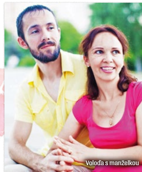
Volodža s manželkou

cirkev je neverná. Ja vidím, čo oni robia!“ Ten pokrstený chlapec bojoval, prežil bitku pod Ilovajskom a vrátil sa bez škrabanca. A prišiel ďakovať.